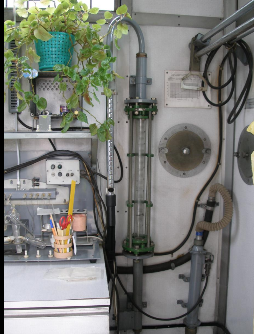
Ротаметр с нагревателем